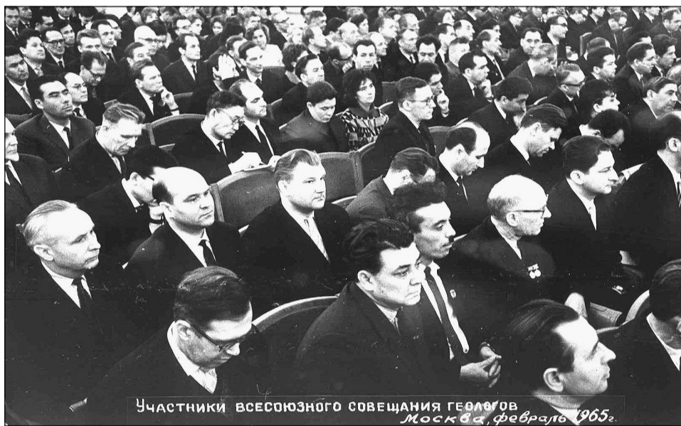
Участники всесоюзного совещания геологов Москва, февраль 1965.

Поражают его неумный импульсивный характер и постоянный боевой настрой с четко ориентированной гражданской позицией. Он периодически пробивается на страницы центральных газет и научных журналов, обращается с персональными письмами к отдельным олигархам и самым авторитетным руководителям властных структур (Д.А. Медведев, В.В. Путин, С.М. Ми-