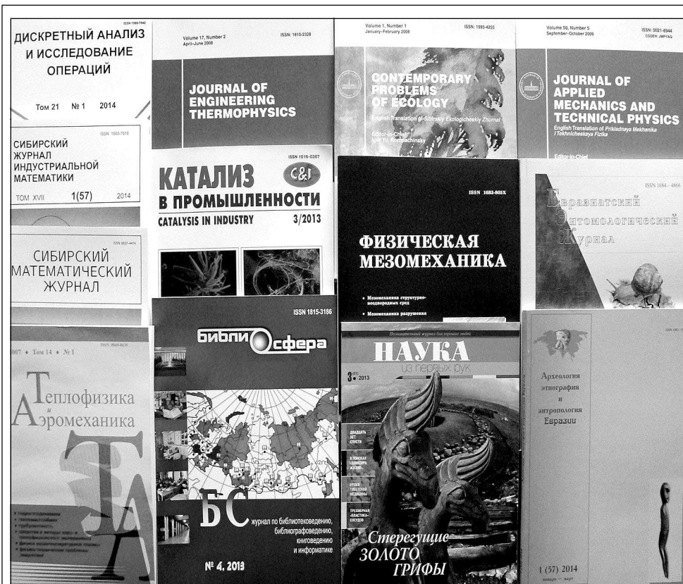
Журналы СО РАН, представленные в БД Scopus