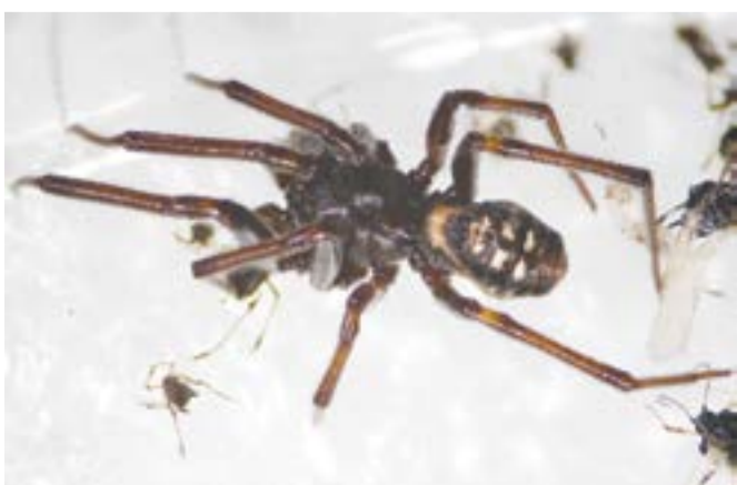
Стеатода белоточечная ( Steatoda albomaculata )

Диана Хомякова