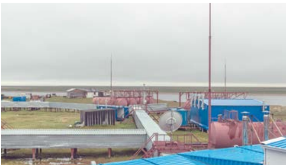
НИС «Остров Самойловский» в 2017-м принял самый многочисленный за 4 года научный отряд

Екатерина Пустолякова