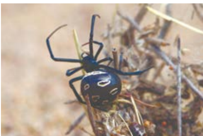
Неполовозрелая самка каракурта, вид сверху