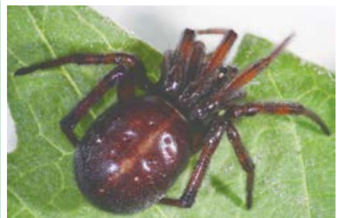
Стеатода двуточечная ( Steatoda bipunctata )