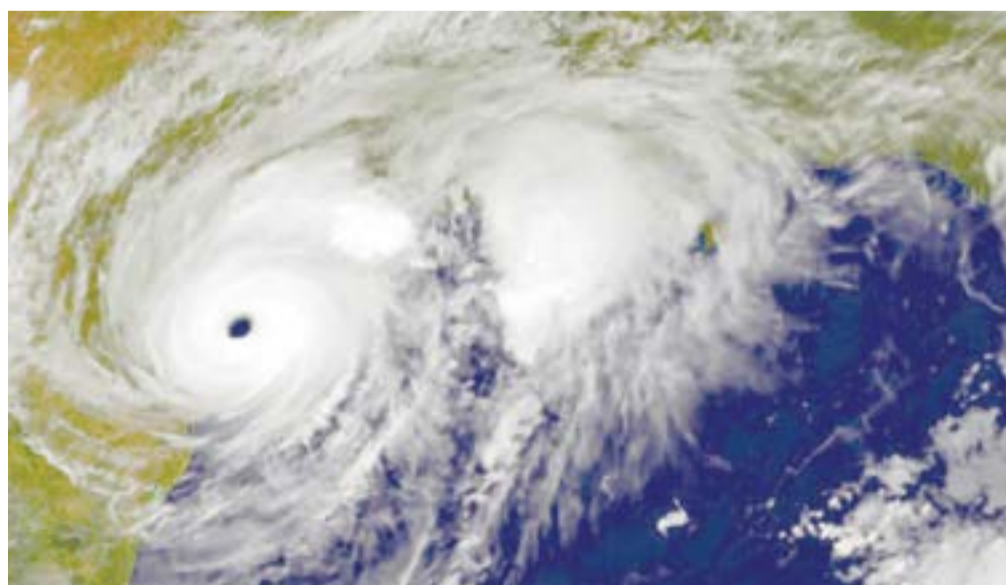
«Харви» — сильнейший ураган в Мексиканском заливе после урагана «Катрина» в 2005 году

Подготовил Андрей Соболевский