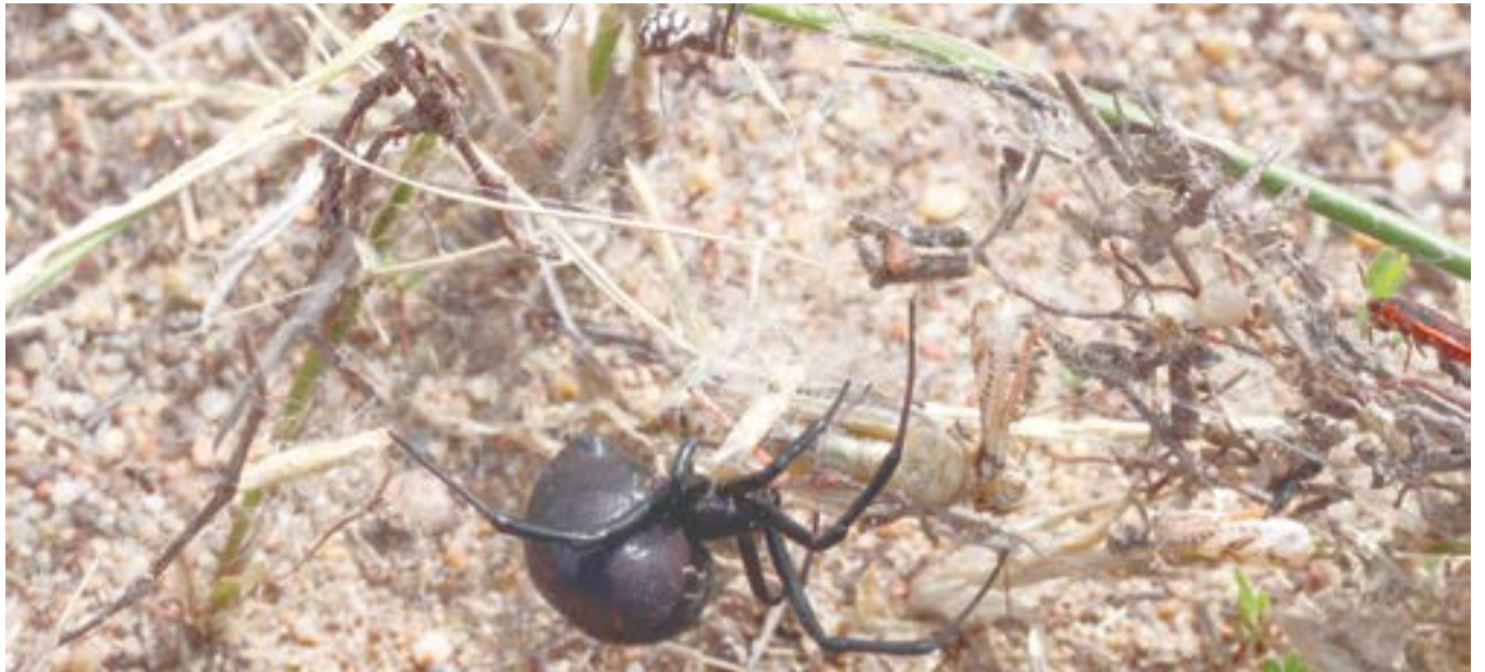
Самец и самка каракурта