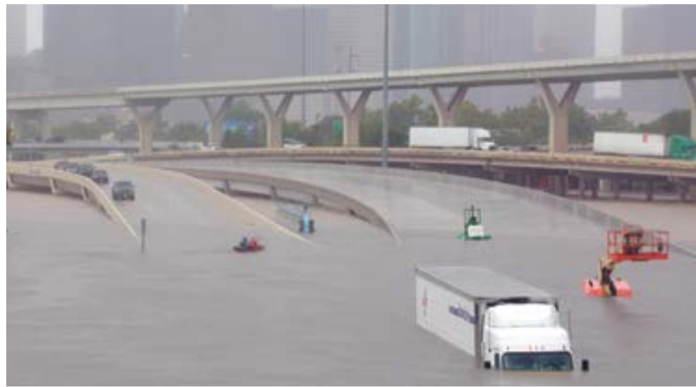
Ураган «Харви» — активный тропический циклон, который вызвал катастрофические наводнения в юго-восточной части Техаса

В сентябре 2005 года из-за ураганов «Катрина» и «Рита» добыча нефти на шельфе Мексиканского залива упала почти в 3 раза (с 1358 до 466 тыс. барр. в среднесуточном исчислении). Для полного восстановления мощностей потребовалось более полугодия. В сентябре 2008 года после ураганов «Айк» и «Густав» произошло более чем пятикратное падение добычи нефти (с 1273 до 242 тыс. барр. в среднесуточном исчислении). Спад был преодолен за четыре месяца. Это не идет ни в какое сравнение с текущими цифрами, которые характеризуют последствия урагана «Харви». По состоянию на 26 августа были эвакуированы экипажи со 112 добычных платформ из 737, полностью остановлена работа 6 из 31 буровых платформ.