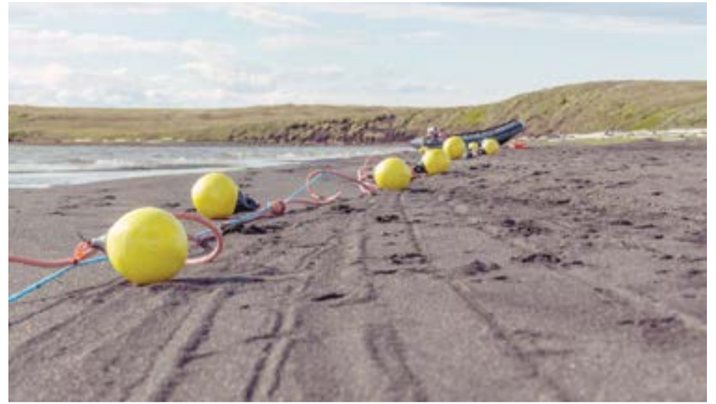
Детальная электротомография позволяет нарисовать границы мерзлоты