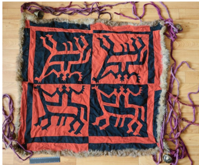
Одеяло с изображением Мир-суснэ-хума