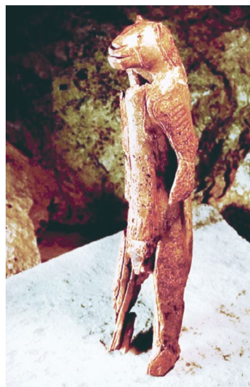
Человеколев (штадельская фигурка)

Даже в наше время на острове Папуа — Новая Гвинея по разным подсчетам существует от 500 до 2 000 языков, и в среднем человек знает четыре-пять из них, чтобы общаться с соседями. При этом язык меняется с такой скоростью, что младшее поколение не всегда понимает своих бабушек и дедушек. Сложно представить, будто предки всех этих людей когда-то говорили на одной языке.