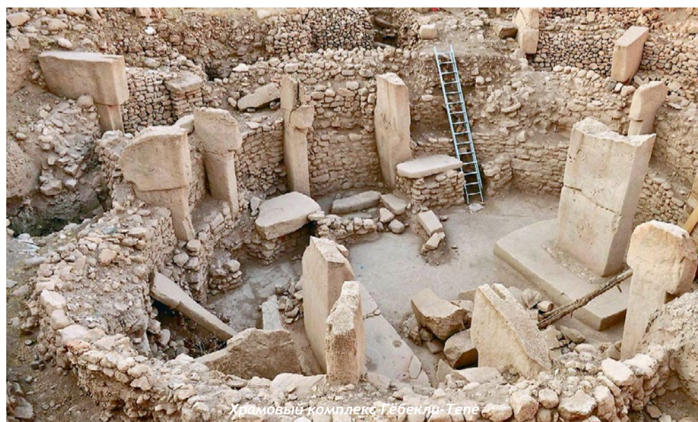
Храмовый комплекс Гёбекли-Тепе

Наталья Бобренок