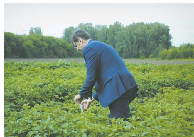
Работа превыше всего!

В каждом мешке находятся клубни, собранные только с одного куста. Представленный кемеровский сорт «кузнечанка» получил высокую оценку от экспертов мероприятия — прежде всего за вкусовые качества. Он выведен специально для Сибири и Дальнего Востока, а еще неприхотлив в уходе.