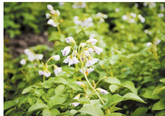
От чего зависит цвет?

Фиолетовый картофель — один из самых экзотических сортов, представленных на Дне поля. Подобные сорта для диетического питания обладают различными оттенками и используются уже давно. Прежде всего носители антоциана (содержащегося в растениях пигментного вещества) являются антиоксидантами, а это большой плюс для здоровья человека: они защищают клетки от различных вредных факторов и способствуют омоложению. Кроме того, фиолетовый картофель очень вкусный и легко выращивается.