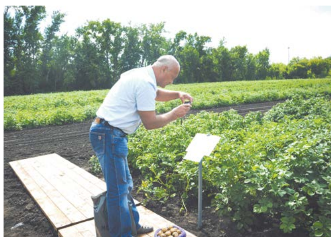
От «А» до «Я»

Еще один выведенный новосибирскими селекционерами сорт «лина» помимо вкусовых качеств и устойчивости к ряду болезней обладает другим преимуществом — высокой крахмалистостью. Также из него получаются хорошие чипсы.