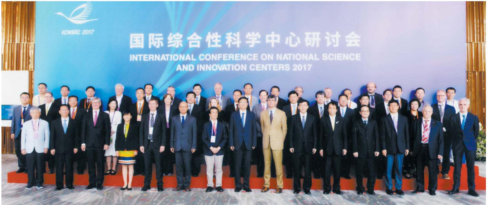
Участники Международной конференции по вопросам организации и деятельности научных и инновационных центров

В июле в пригороде Пекина Хайроу (Huairou) состоялась Международная конференция по вопросам организации и деятельности научных и инновационных центров (International Conference on National Science and Innovation Centers 2017), организованная мэрией Пекина и Академией наук Китая.