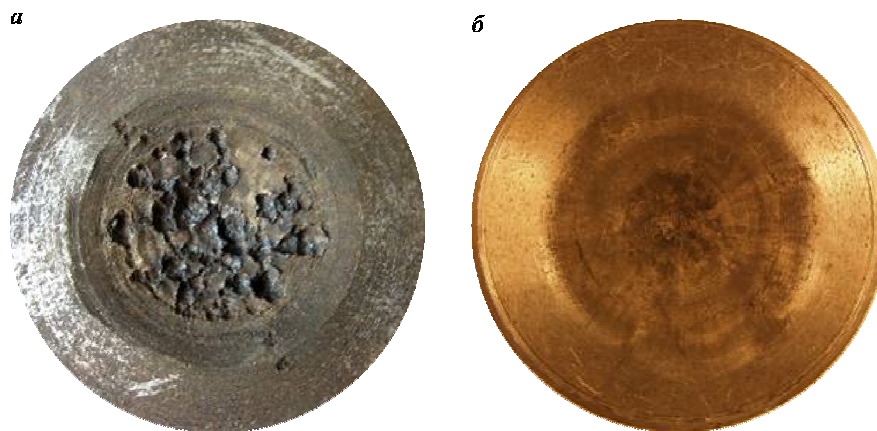
Рис. 27. След детонации зарядов ЛКВМ (а) и пластифицированного полимера (б) на торцевой металлической пластине.

гласуется с результатами по влиянию размера частиц основного взрывчатого вещества, влиянию скорости детонации полимерной прослойки между кристаллами базового ВВ, увеличе-