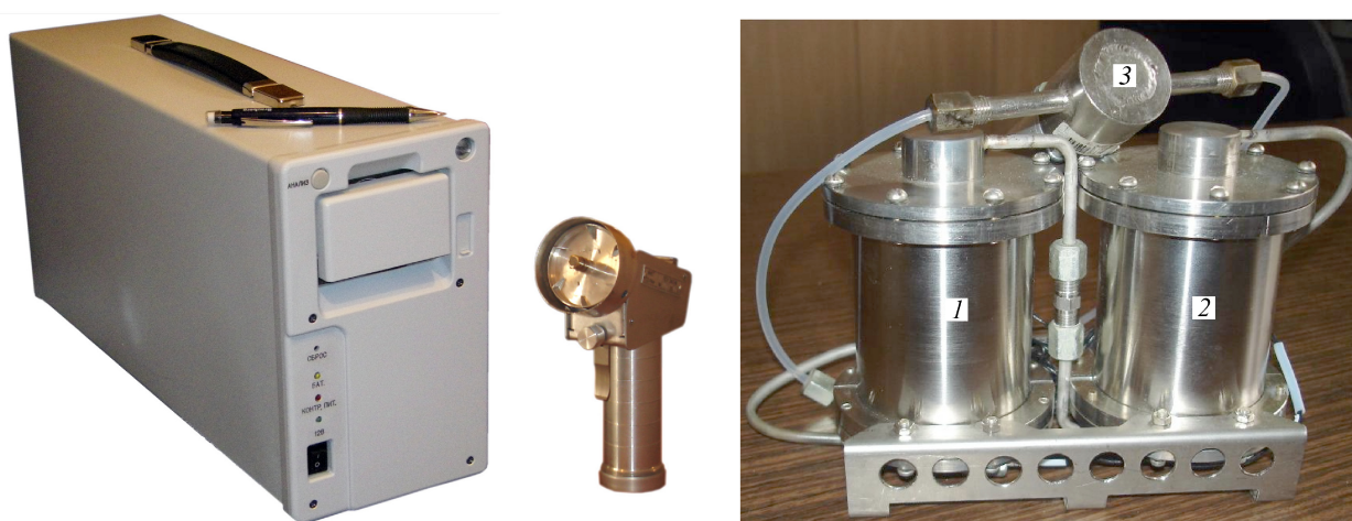
Рис. 54. Газовый хроматограф «ЭХО-В-М» и блок глубокой очистки воздуха (1 — фильтр с сорбентом ИК-011-1; 2 — фильтр с молекулярными ситами NAX; 3 — датчик измерителя микровлажности газов ИПВТ-07).