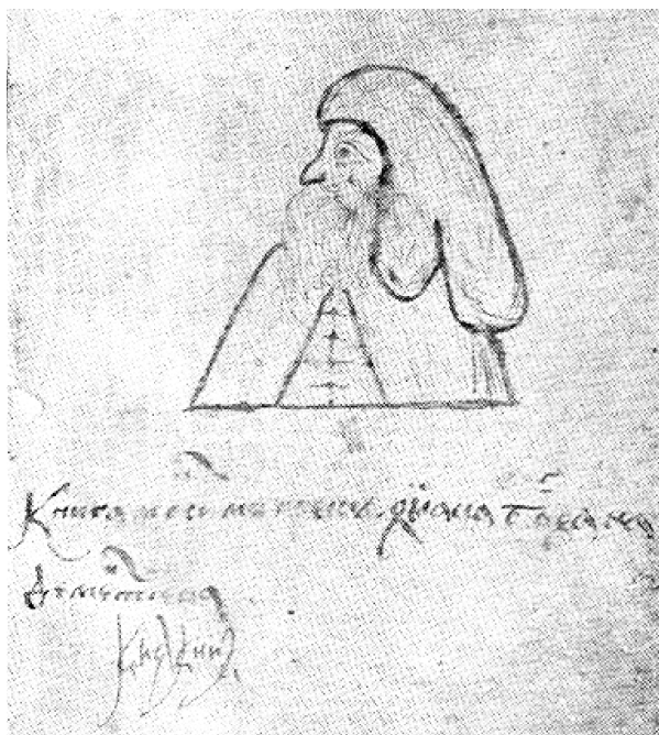
Рис. 9. Преподобный Максим Грек. Рисунок в рукописи XVI в.

В том же Институте впервые в отечественной историографии показан процесс формирования Сибирской армии, организованной в ходе антибольшевистского переворота в конце мая 1918 г. в Новониколаевске, контролирующей территорию от Урала до Тихого океана (рис. 10). Представлена эволюция организационной структуры Сибирской армии, проанализирована система управления, комплектования