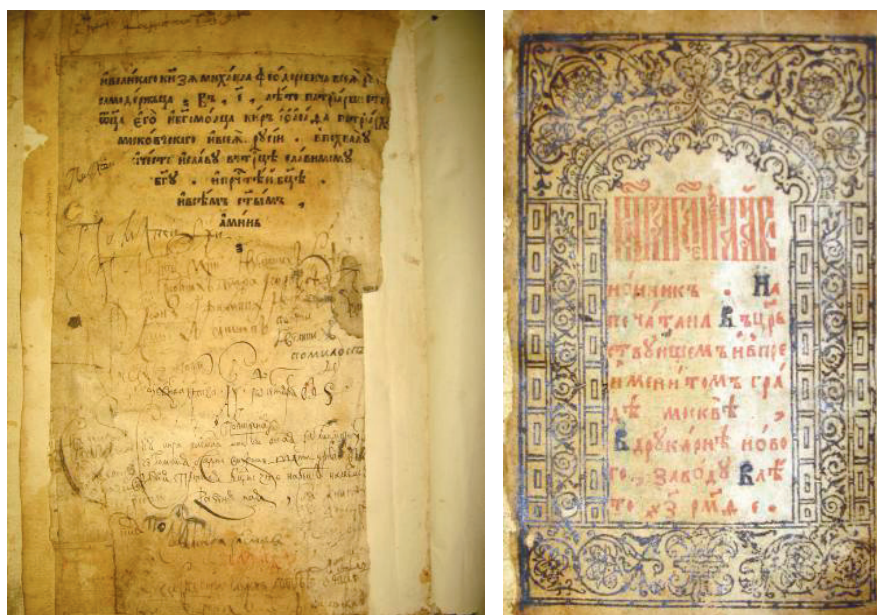
Рис. 7. Важнейшие находки экспедиционных исследований.

хомирова и составила 810 единиц хранения. Среди новых электронных памятников два издания Ивана Федорова и Кормчая, десятилетиями приковывающая к себе внимание историков древнерусского права. В результате палеографического исследования этого памятника установлено, что два неполных списка Кормчей книги из собрания М. Н. Тихомирова (№ 536 и 539, ГПНТБ СО РАН, Новосибирск) некогда были единой рукописью, появившейся в конце XV—начале XVI вв. на основе двух рукописных фрагментов Псковской Кормчей конца XIV и середины XV вв. Профессиональная версия цифровой библиотеки доступна на CD/DVD-носителях и в локальной сети ГПНТБ СО РАН для зарегистрированных пользователей. Интернет-версия системы (ограничен-