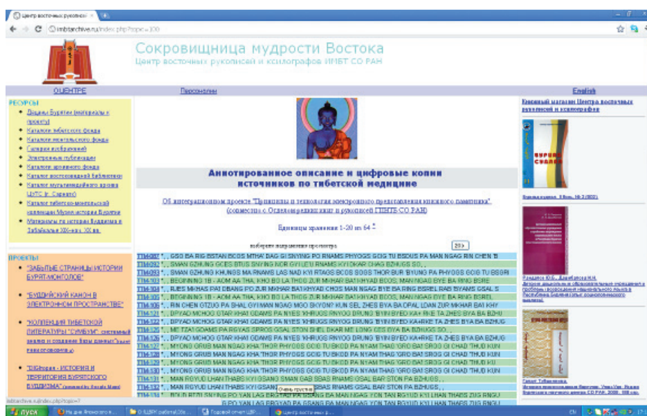
Рис. 9. Страница сайта с аннотированным описанием и полнотекстовыми цифровыми копиями источников по тибетской медицине.

Конфиденциально из Тибета: письма Тринадцатого Далай-ламы Агвану Доржиеву 1910—1925 / Введение, перевод, комментарии Николая Цыремпилова и Джампа Самтена / Библиотека тибетских трудов и архивов. Дхарамсала, Индия, 2011. — 12 + 211 с.